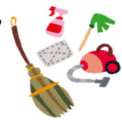
あいほうぶ吹田と車内清掃作業の様子